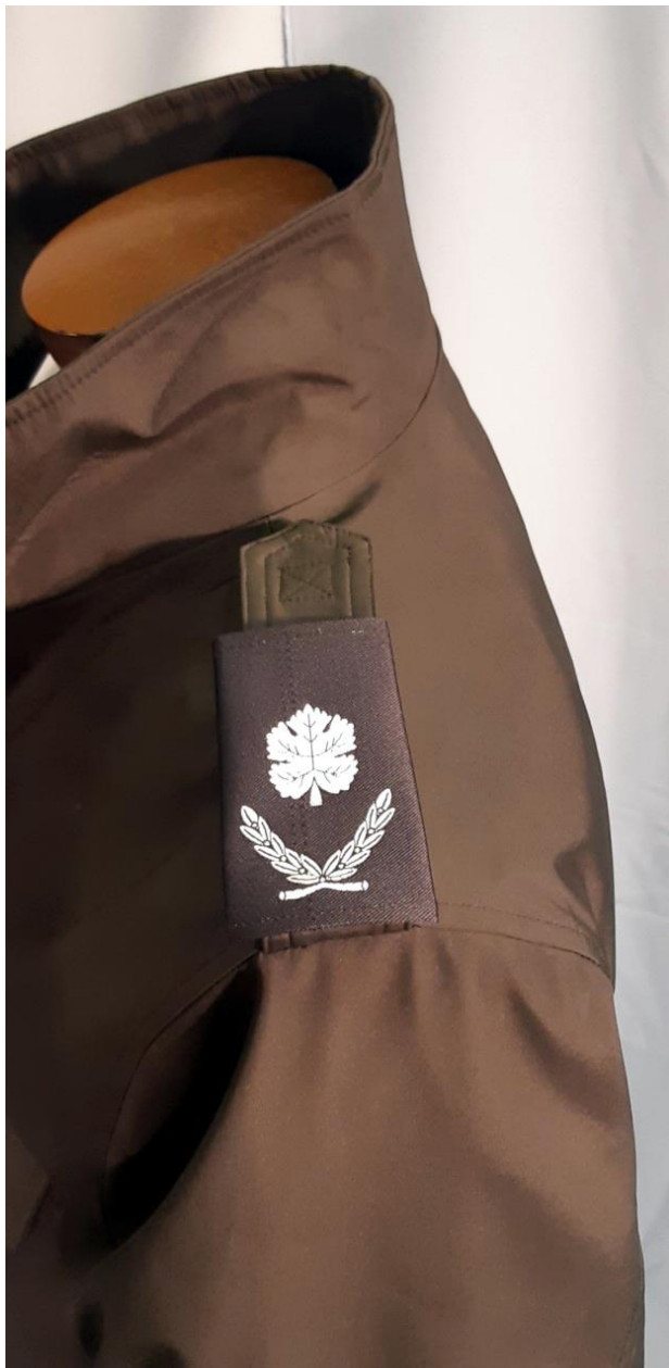
תמונה – נראות כותפת